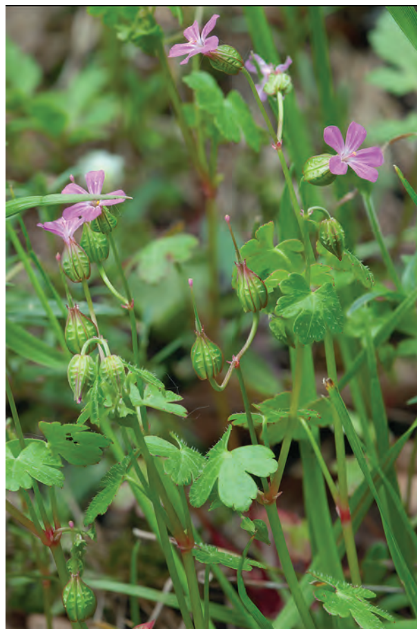
Slika 6: Blesteča krvomočnica ( Geranium lucidum ) z značilnimi prečno rebrastimi plodovi (glavica s kljuncem).

Figure 5: Geranium lucidum - a flower and leaves.