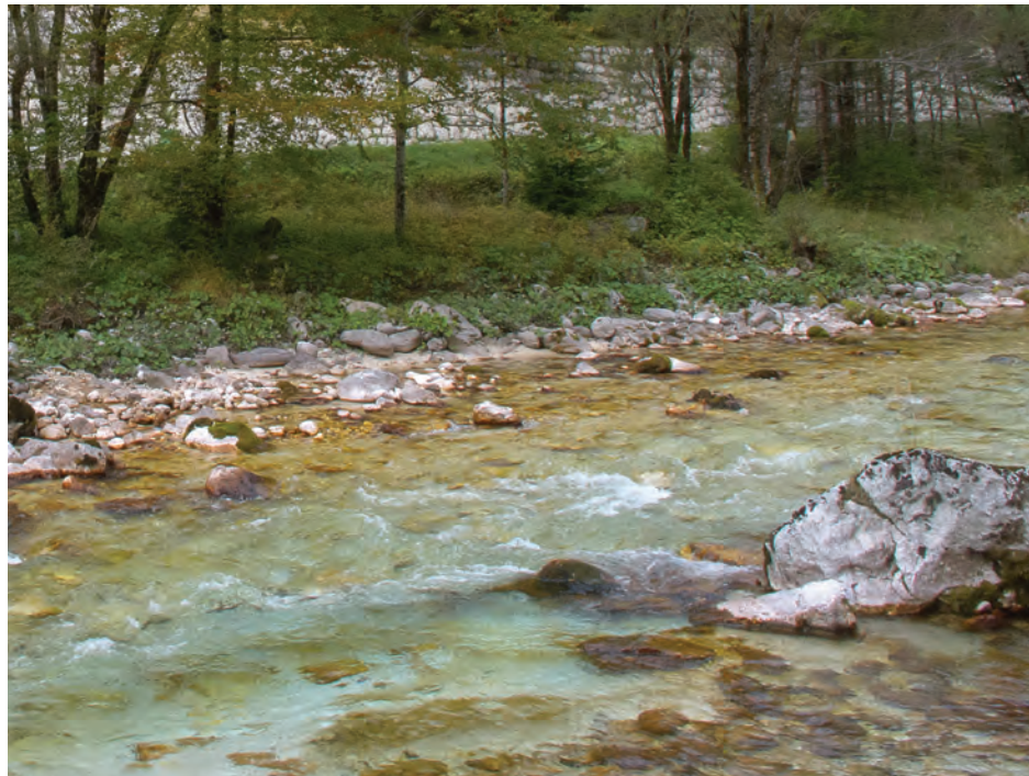
Slika 2: Pogled na prvo mikrorastišče, ruderalizirano travišče med cesto Bovec–Vršič in reko Sočo pri domačiji Martin, Soča 46 v približni izmeri 3 m x 35 m. Figure 2: A view on the first micro-locality, ruderalized grassland between the regional road Bovec–Vršič and the river Soča near farmhouse Martin, Soča 46, measuring about 3 m x 35 m.