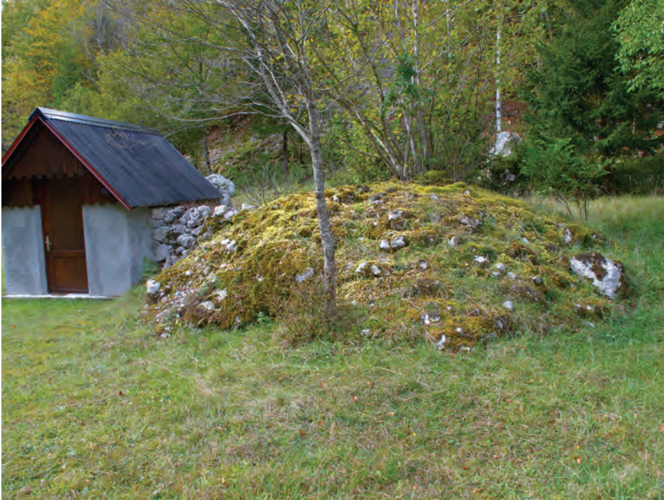
Slika 3: Pogled na drugo mikrorastišče, obraslo grobljo iz skal in kamena, ki je nastala s človekovim delovanjem, pri osnovanju in čiščenju travnišč. Figure 3: A view on the second micro-locality, a heap of stones and rocks collected by man during establishment and cleaning of neighboring agricultural land.