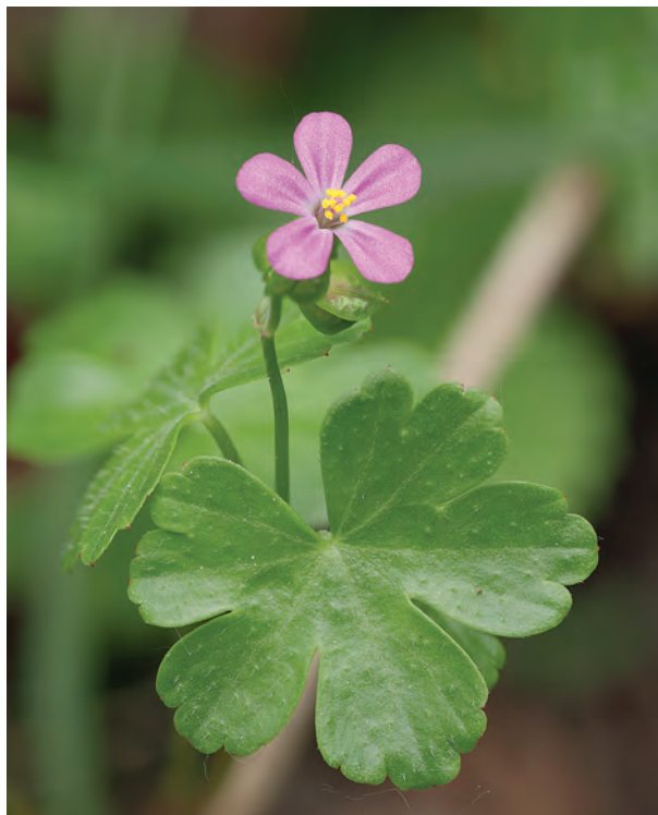
Slika 5: Blesteča krvomočnica ( Geranium lucidum ) - cvet in listi.

Figure 5: Geranium lucidum - a flower and leaves.