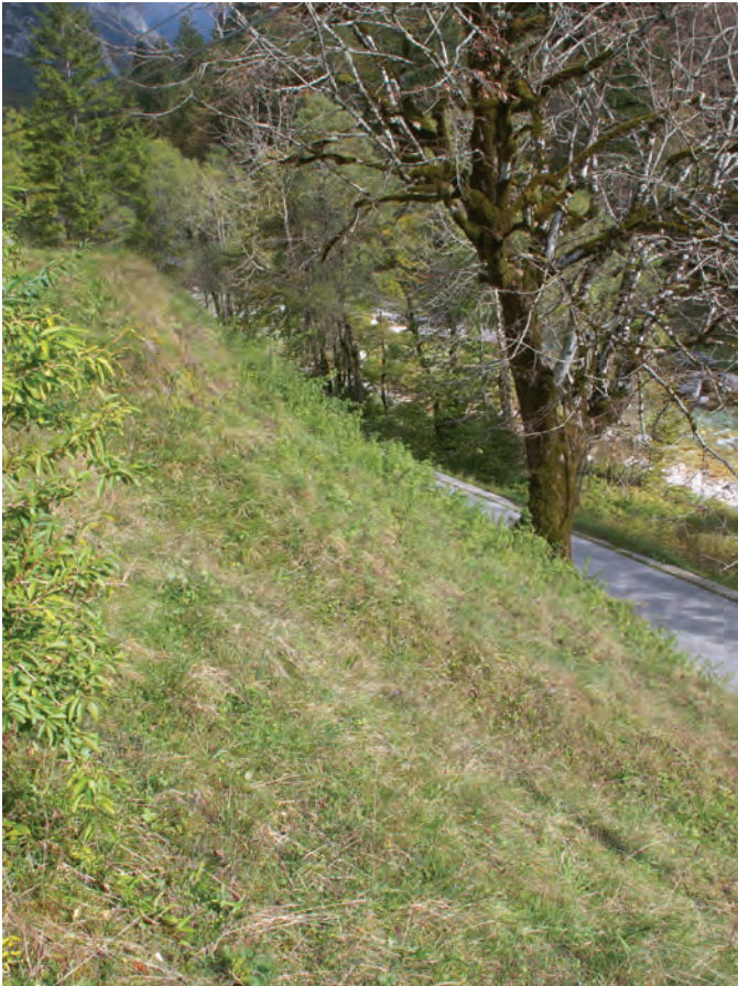
Slika 4: Pogled na tretje mikrorastišče, strmo travnato pobočje med robom rečne terase in cesto oziroma reko. Figure 4: A view on the third micro-locality consisting of a steep grassy slope descending from the edge of the alluvial terrace down to the road and the river bed.