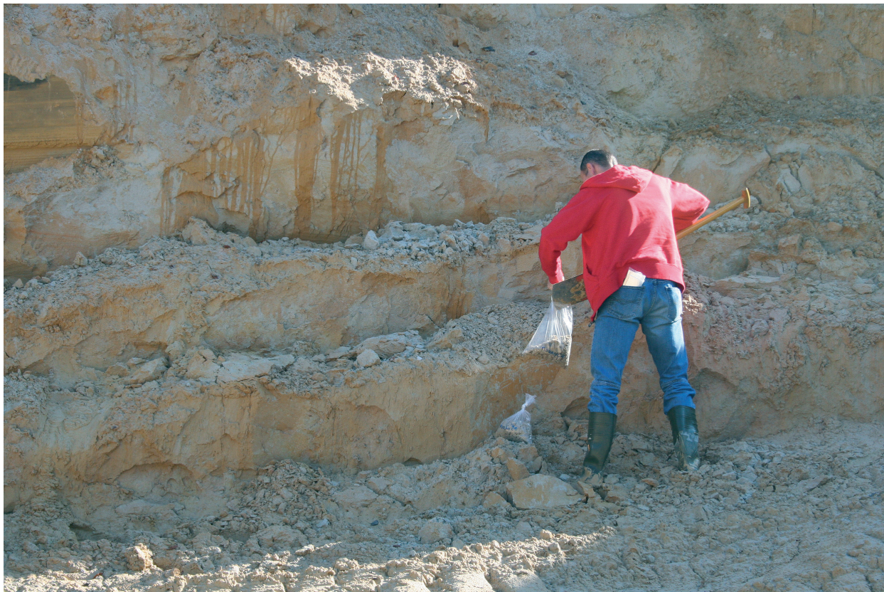
Slika 4: Jemanje vzorca kremenovega peska v kamnolomu v Moravčah za laboratorijske raziskave njegovega insekticidnega delovanja na riževega žužka Figure 4: Taking the sample of quartz sand in quartz quarry in Moravče, which was used for laboratory investigations of its insecticidal activity against the rice weevil

V iskanju učinkovitih (in) okoljsko sprejemljivih načinov zatiranja odraslih osebkov fižolarja ( Acanthoscelides obtectus ) smo preučevali insekticidno delovanje dveh rastlinskih prahov (slika 5) in DZ v laboratorijskih razmerah. Delovanje prahov navadne sivke ( Lavandula angustifolia ) in njivske preslice ( Equisetum arvense ) smo primerjali s pripravkom SilicoSec pri petih temperaturah (15, 20, 25, 30 in 35°C), dveh vrednostih relativne zračne vlage (55 in 75 %) in štirih koncentracijah prahov (100, 300, 500 in 900 ppm). Smrtnost hroščev smo ugotavljali 1, 2, 4 in 7 dni po nastavitvi poskusa.