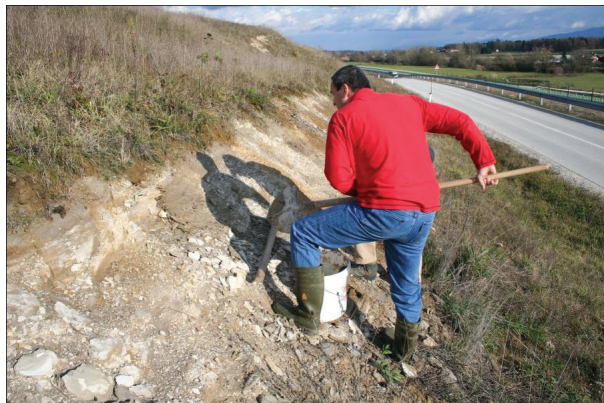
Slika 1: Lokacija v bližini Bele Cerkve, kjer smo 11. novembra 2007 prvič nabrali diatomejsko zemljo za laboratorijske raziskave

S ciljem določitve učinkovitosti diatomejske zemlje (DZ) različnega izvora pri zatiranju riževega žužka ( S. oryzae ) smo izvedli laboratorijsko raziskavo. V primerjavi s tržnim pripravkom SilicoSec® smo preizkušali insekticidno delovanje DZ iz Srbije, Grčije in Slo-