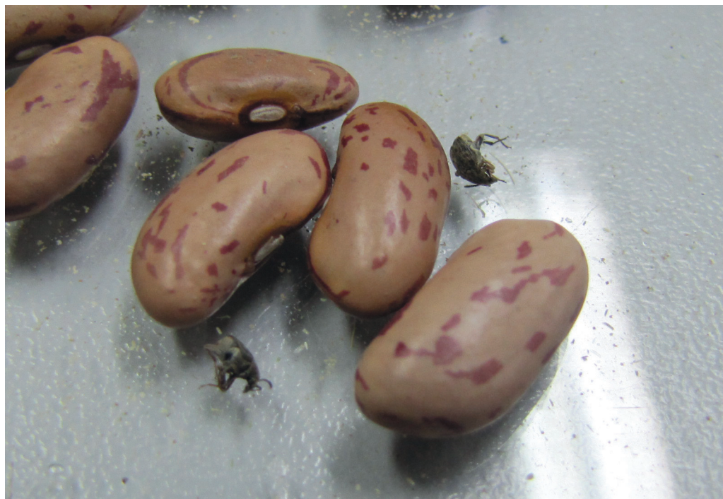
Slika 5: Odrasla osebkca fižolarja v poskusu ugotavljanja insekticidnega delovanja rastlinskih prahov Figure 5: Bean weevil adults in the investigation of insecticidal efficacy of plant powders