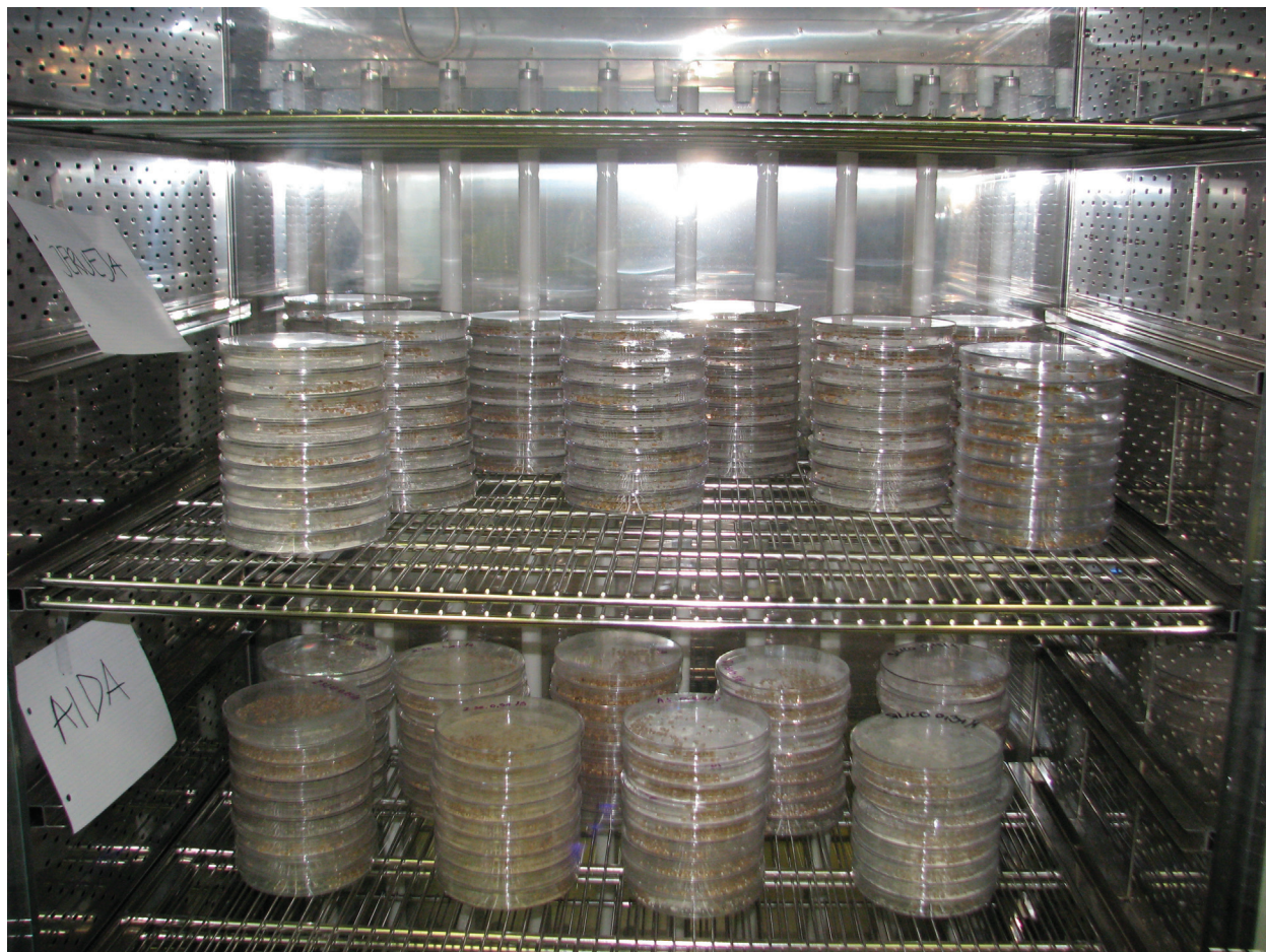
Slika 8: Petrijevke, v katerih smo v rastni komori preizkušali insekticidno delovanje lesnega pepela in zeolitov na koruznega žužka

Za zatiranje črnega žitnega žužka ( S. granarius ) smo v laboratorijskih razmerah preučevali učinkovitost različnih okoljsko sprejemljivih snovi. Zrnju pšenice smo pred vnosom škodljivca v erlenmajerice v ločenih obravnavanjih primešali diatomejsko zemljo (pripravek SilicoSec®), kremenov pesek, listni prah dre-