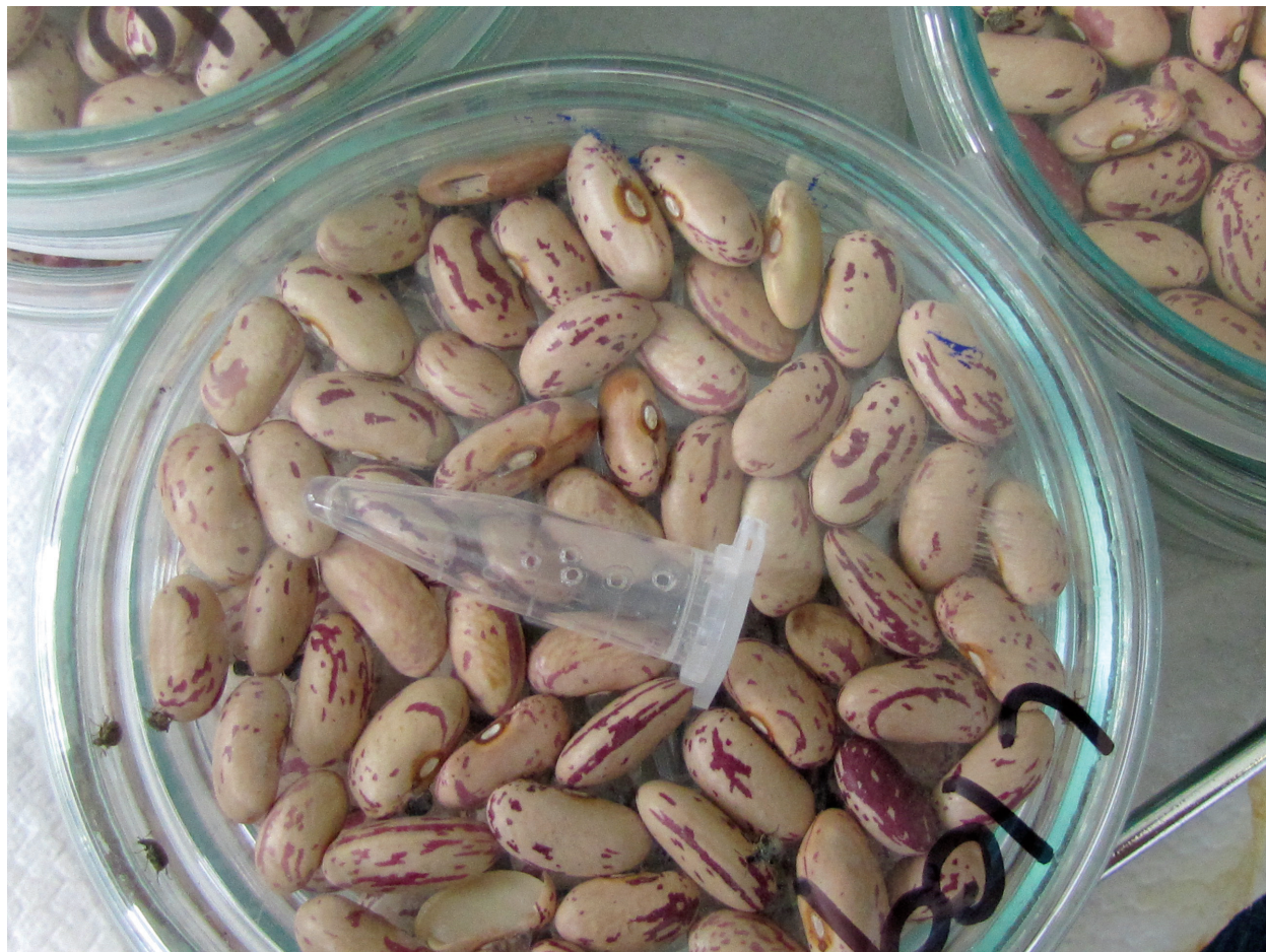
Slika 9: Perforirana mikrocentrifugirka v petrijevki, v kateri smo preučevali fumigantno delovanje eteričnih olj na fižolarja

V petrijevkah s fižolovim zrnjem smo preučevali fumigantno delovanje eteričnih olj (slika 9) navadnega