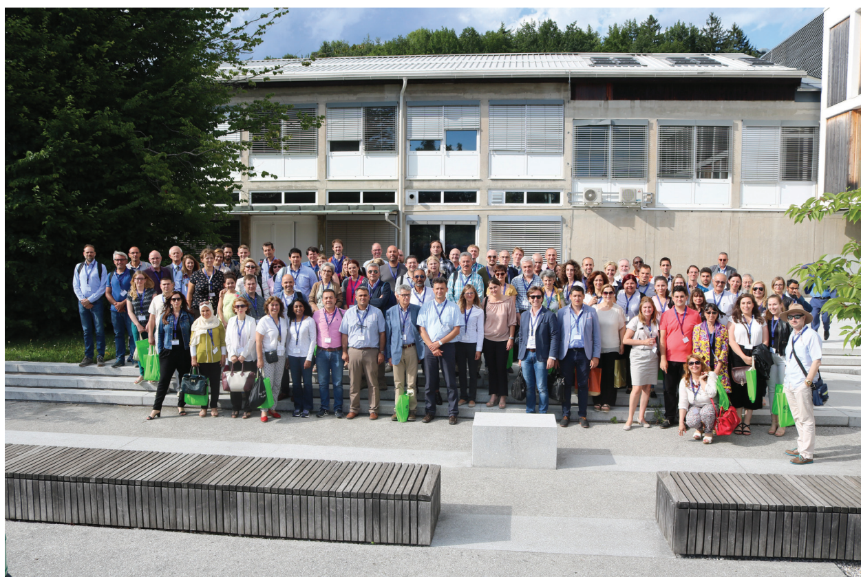
Slika 10: Udeleženci 11. konference IOBC/wprs delovne skupine za integrirano varstvo uskladiščenih pridelkov, ki je bila v Ljubljani med 3. in 5. julijem 2017

14 in 21 dni po nastavitvi poskusa. V večini obravnavanj smo potrdili, da se je 7. dan po nastavitvi poskusa z naraščanjem temperature povečevala smrtnost hroščev, z naraščanjem vlage pa se je zmanjševala. 7 dni po začetku poskusa je bila smrtnost hroščev večja na zrnju iz ekološke pridelave kot na zrnju iz integrirane pridelave. Potomce koruznega hrošča smo v zrnju našli 56 dni po odstranitvi hroščev, več pa jih je bilo pri 75 % relativni zračni vlagi. Pri 55 % relativni zračni vlagi in 20°C je bilo potomstvo škodljivca na zrnju v ekološki pridelavi za 60,8 % večje kot v integrirani pridelavi. Smrtnost hroščev je bila v optimalnih razmerah skladiščenja večja na zrnju iz alternativnih oblik pridelave pšenice kot na zrnju iz integrirane pridelave. Ugotavljamo, da je razumevanje agronomskih tehnologij, biotičnih in abiotičnih dejavnikov, ki vplivajo na pojavljanje skladiščnih škodljivcev, lahko zelo uporabno pri uporabi oz. razvoju strategij zatiranja škodljivcev (TURINEK et al., 2016).