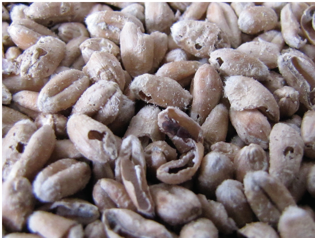
Slika 3: Zrnje pšenice s poškodbami zaradi riževega žužka Figure 3: Wheat grains with injuries caused by rice weevil

Za zatiranje riževega žužka ( S. oryzae ) (slika 3) pa smo v laboratorijskih razmerah preučevali tudi učinkovitost petih vzorcev kremenovega peska iz Slovenije (slika 4). V šestih različnih koncentracijah (100, 300, 500, 900, 1200 in 1500 ppm) smo ugotavljali insekticidno delovanje vzorcev iz lokacij Raka-Ravno in Moravče (v obeh primerih neočiščenega in očiščenega vzorca) ter tržno dostopnega kremenovega peska iz Puconcev (Plantella). Vsebnost SiO 2 je bila v vseh vzorcih visoka in je znašala od 91,52 do 99,24 %. Insekticidno delovanje kremenovega peska, ki smo ga primešali zrnju pšenice, smo preučevali pri temperaturah 20, 25, 30 in 35 °C in pri 55 in 75 % relativni zračni vlagi. Smrtnost hroščev smo ugotavljali 7, 14 in 21 dni po nastavitvi. Vsi vzorci so imeli samo majhen insekticidni učinek na odrasle osebkke riževega žužka in se niso izkazali kot ustrezni za širšo uporabo v skladiščih žita. Najvišjo smrtnost (15 %) hroščev smo potrdili 21. dan po nastavitvi poskusa pri koncentraciji 900 ppm, 30 °C and 55 % relativni zračni vlagi pri neočiščenem vzorcu kremenovega peska iz Moravč (ROJHT et al., 2010c; ROJHT et al., 2011).