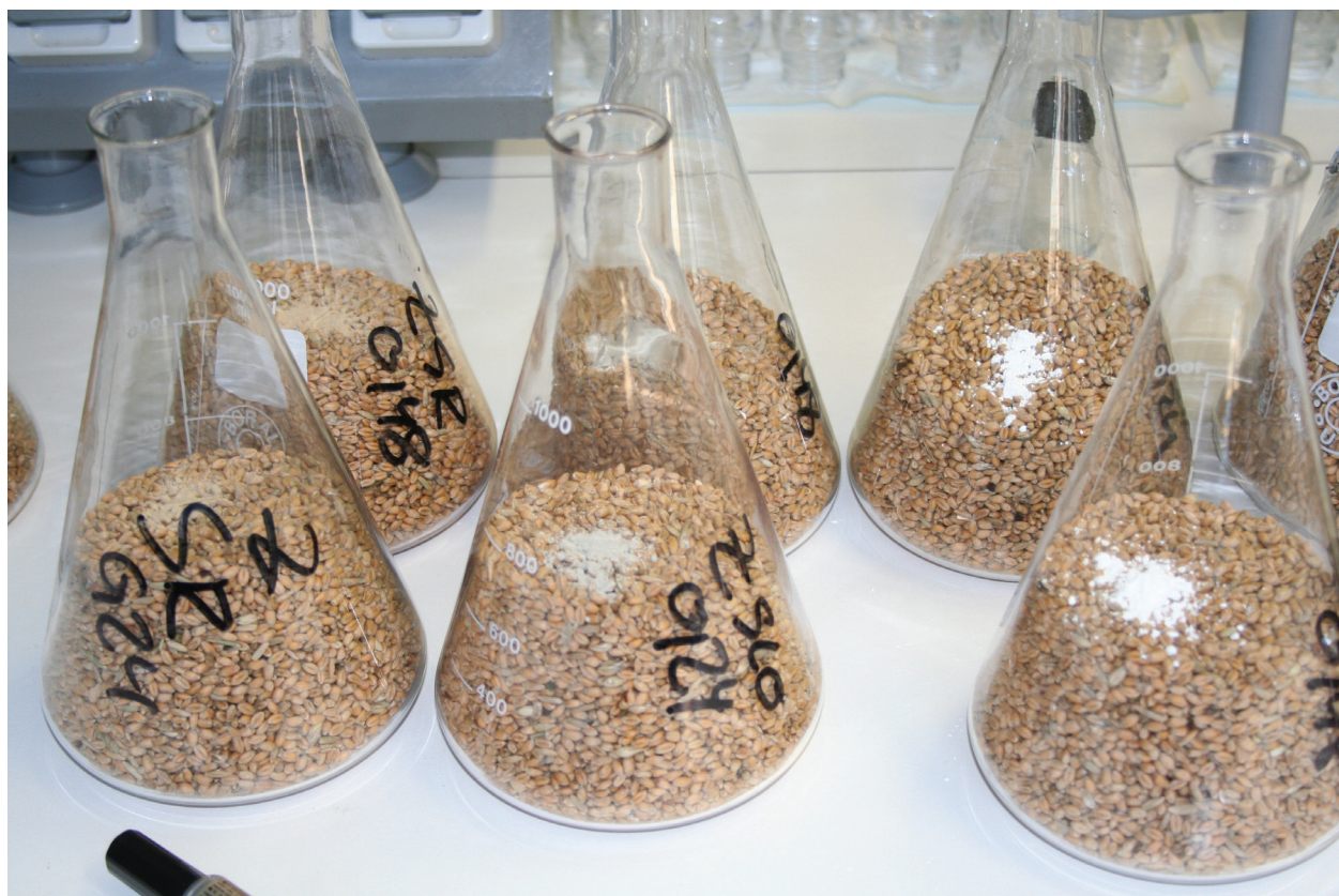
Slika 7: Erjenmajerice s zrnjem pšenice in zeoliti pred mešanjem

vršinskem nanosu snovi smo dnevno ugotavljali do 7. dneva po nanosu, nato pa smo od 8. do 14. dneva po nanosu ugotavljali še t.i. zapoznelo smrtnost odraslih osebkov. Insekticidno delovanje zeolitov, primešanih zrnju pšenice, smo določevali 7., 14. in 21. dan po začetku poskusa. Ugotavljamo, da sta na večjo smrtnost hroščev vplivala višja temperatura in nižja relativna zračna vlaga. Pri mešanju naravnega zeolita iz Slovenije z zrnjem pšenice v koncentraciji 900\text{ ppm} , smo pri 15\text{ }^{\circ}\text{C} in 55\% relativni zračni potrdili 69,69 \pm 7,04\% smrtnost hroščev 21 dni po nastavitvi poskusa, medtem, ko smo pri 25\text{ }^{\circ}\text{C} ugotovili 83,66 \pm 3,21\% smrtnost hroščev. 100\% smrtnost hroščev smo pri uporabi zeolita iz Slovenije ugotovili pri površinskem nanosu že 7 dni po začetku poskusa pri 25\text{ }^{\circ}\text{C} . Koncentracija zeolita ni imela vpliva na smrtnost hroščev. Vzorca naravnega zeolita iz Srbije in Slovenije sta imela primerljivo delovanje na odrasle osebe koruznega hrošča, najslabše insekticidno delovanje pa je imel sintetični zeolit Asorbio®. Ugotavljamo, da naravni zeoliti imajo potencial za uporabo pri zatiranju skladiščnih škodljivcev, pred njihovo implementacijo v sisteme skladišče-