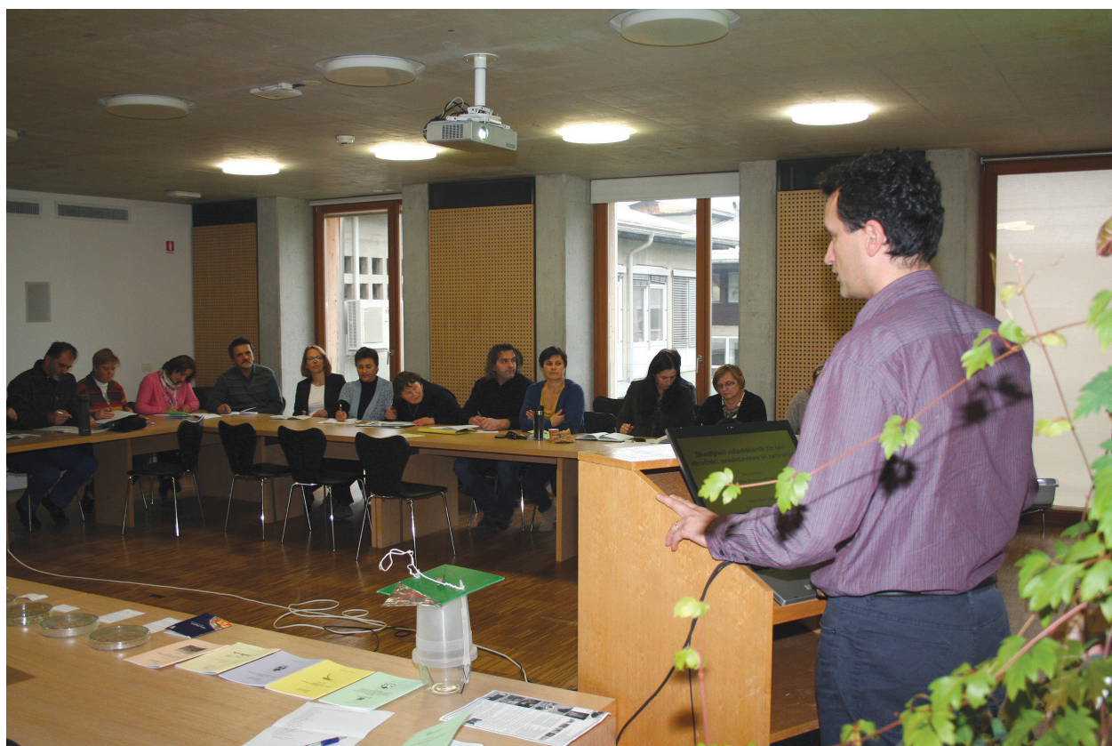
Slika 11: Delavnica »Od tehnološke zrelosti do skladiščenja žit in stročnic«, ki je bila 27. novembra 2014 na Biotehniški fakulteti v Ljubljani

Pod koordinatrstvom C. Athanassiou-a, v kateri sva bila tudi slovenski raziskovalec in študentka, je mednarodna raziskovalna skupina preučevala delovanje pirimifos-metila, formuliranega kot elektrostatični prah, da bi s tem zmanjšali količino te aktivne snovi na zrnju. Učinkovitost insekticida v tej formulaciji so primerjali z njegovim delovanjem v formulaciji koncentrata za emulzijo (EC) pri zatiranju hroščev Sitophilus oryzae , Oryzaephilus surinamensis , Rhyzopertha domi-