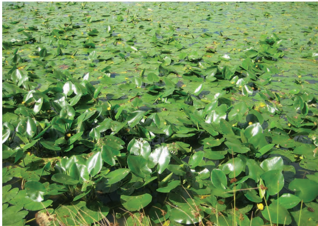
Slika 3: Rumeni blatnik ( Nuphar luteum ). Škalsko jezero Figure 3: Nuphar luteum . Lake Škalsko jezero.