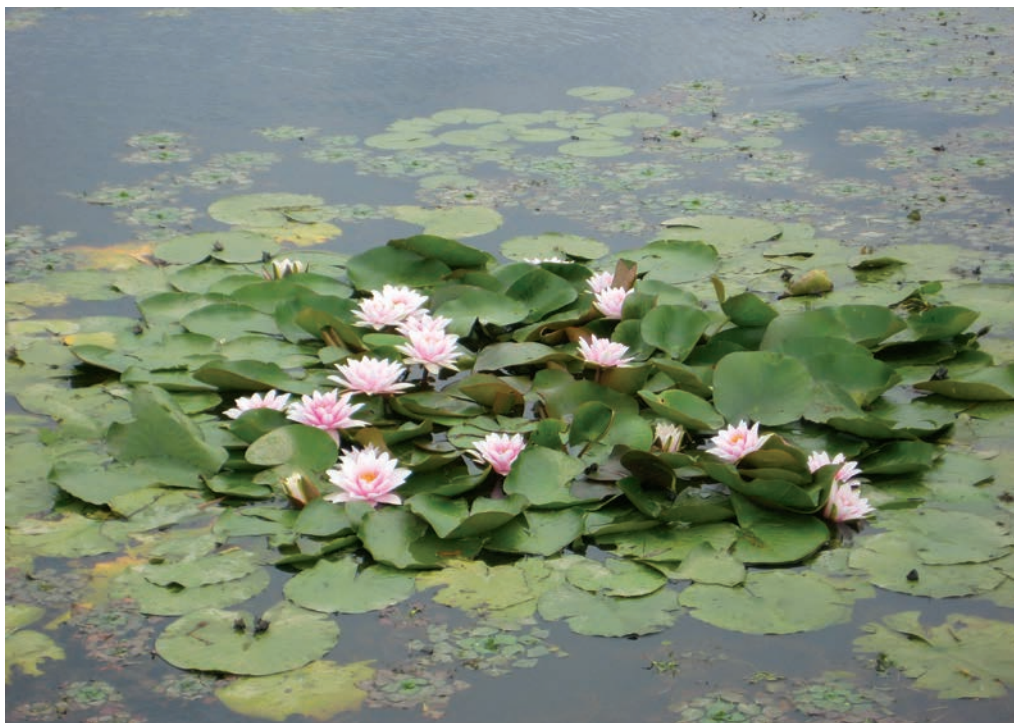
Slika 2: Beli lokvanj ( Nymphaea alba ). Zadrževalnik Medvedce. Figure 2: European white water lily ( Nymphaea alba ). Accumulation Medvedce.