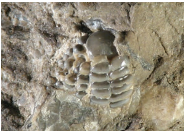
Slika 3. Desna polovica zgornje žrelne čeljusti vrste Labrodon pavimentatum iz spodnjemiocenskih plasti Klanca nad Dobrno

Figure 3. The right half of upper pharyngeal jaw of Labrodon pavimentatum from Lower Miocene beds of Klanc above Dobrna